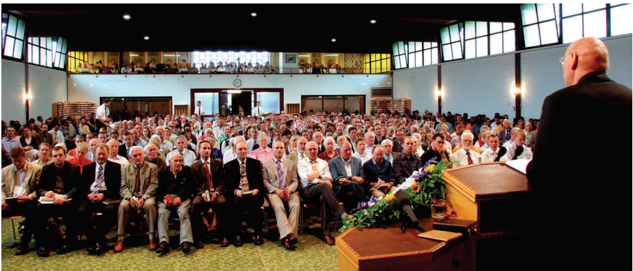
Photographie de la réunion lors du premier week-end de septembre 2006 à Krefeld, à laquelle prirent part des frères et sœurs de toute l'Europe, venus pour écouter la Parole de Dieu. La faim spirituelle est perceptible, la nourriture spirituelle est prête.