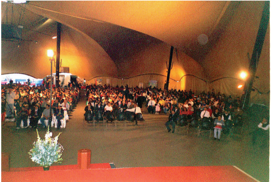
Photographie d'une réunion à Lima, au Pérou, en octobre 2005