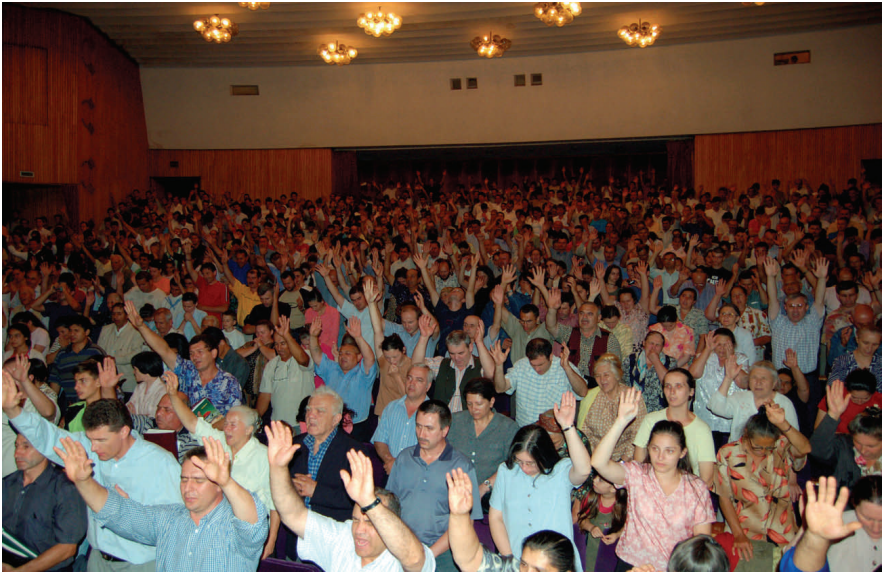
Photographie d'une réunion en Roumanie, en août 2006. Dans cette brochure, nous ne pouvons publier que quelques-unes des nombreuses photographies prises dans le monde entier. La moisson est grande